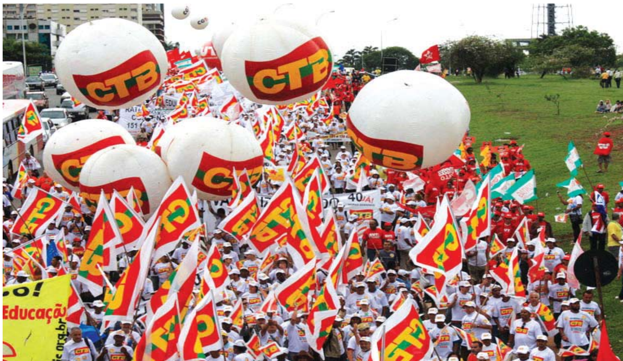
Manifestação dos trabalhadores e trabalhadoras em favor dos direitos coletivos

É oportuno destacar que tanto os servidores quanto a sociedade confiam, reconhecem o trabalho e a importância do Ministério Público no aperfeiçoamento da democracia brasileira, na defesa dos interesses sociais e da ordem jurídica, pois o mister desse Órgão é imprescindível, inalienável e sublime em nossa democracia. Os possíveis equívocos e negligências expostos acima, são atos de responsabilidades não do Ministério Público, e sim de quem está a seu serviço. Os representantes do Ministério Público da Bahia, decerto, não permitirão que a vaidade e os interesses privados de uma pequena parcela de seus pares ruborizem a imagem do Órgão que eles, por meio de seu trabalho e conduta ilibada, ajudam a elevar e construir.